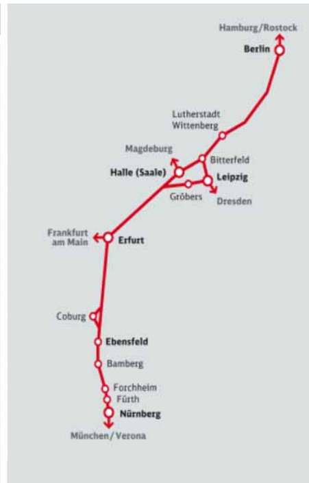
Bild 2. Strecke, Zahlen und Fakten des Projekts VDE 8 im Überblick.