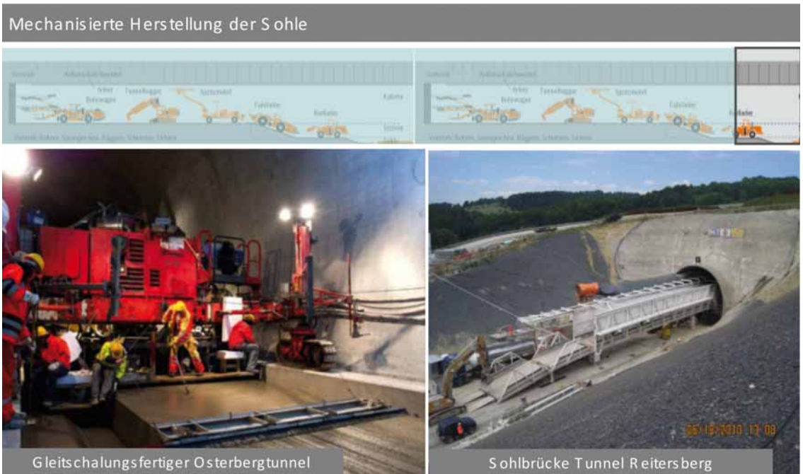
Bild 4. Tunnel in NÖT-Bauweise.