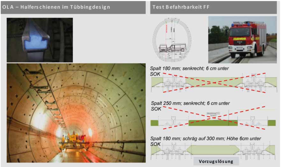
Bild 5. Oberleitung und Feste Fahrbahn.

liegen zwischen 300 und 8.300 m. Ein Tunnel entstand im Maschinenvortrieb, die anderen im Spreng- beziehungsweise Baggervortrieb (Bild 4). Zwischen Ebensfeld und Erfurt werden sie zweigleisig ausgeführt, zwischen Erfurt und Leipzig/Halle als zwei parallele eingleisige Röhren. Nimmt man den mit Maschinenvortrieb geplanten knapp 7 km langen Güterzugtunnel in Nürnberg/Fürth hinzu, kommen für das Projekt VDE 8 27 Tunnel mit über 64 km Gesamtlänge zusammen. Das bedeutet, dass 12,6 Mio. m 3 Ausbruch zu bewältigen sind.