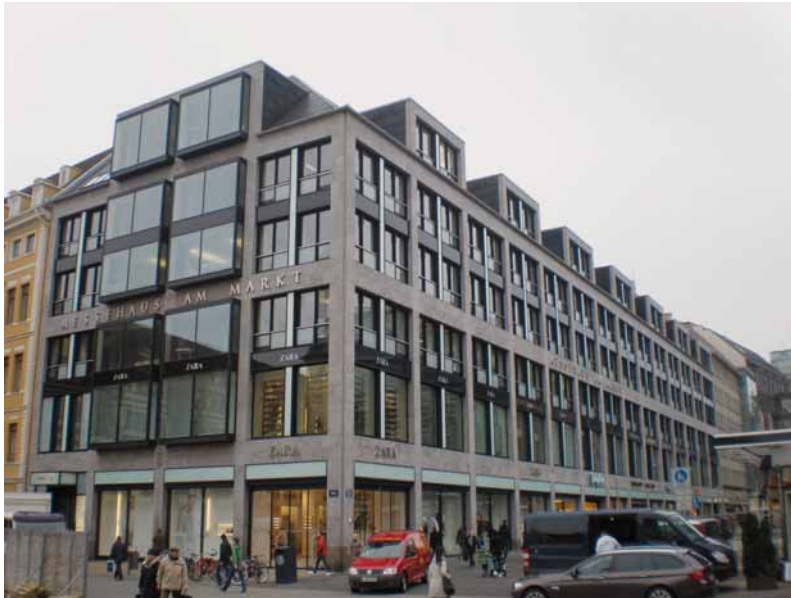
Bild 5. Das Messehaus am Markt.

Sichere und schadlose Ausführung innerstädtischer Tunnelvortriebe – Das Beispiel City-Tunnel Leipzig