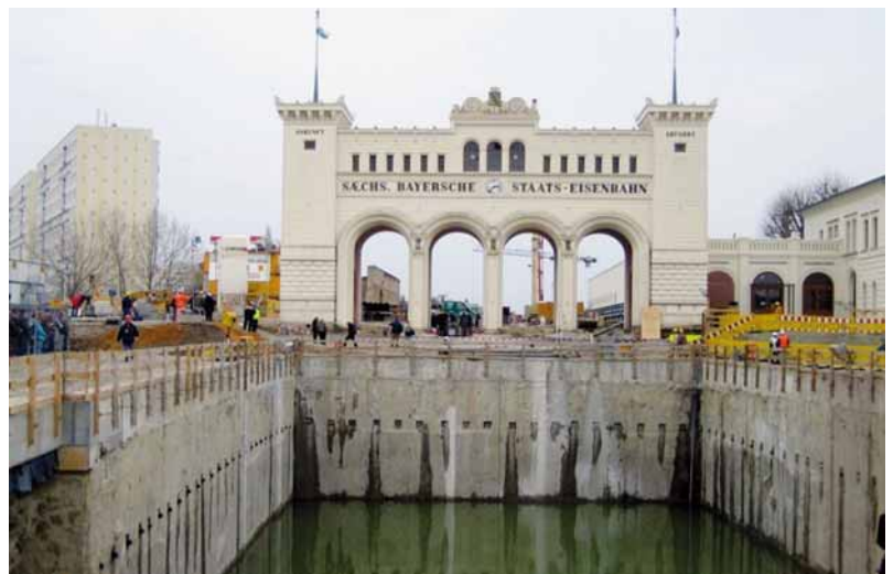
Bild 1. Portikus mit Baugrubenverbau Bayerischer Bahnhof.

Somit konnte der Bau des Haltepunkts unabhängig von Sicherungsmaßnahmen an der