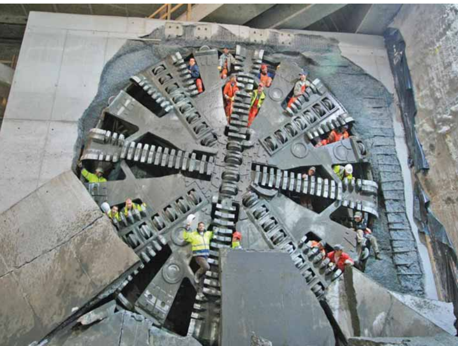
Bild 2. Ausfahrt in die Station Hauptbahnhof am 31.10.2008.

Sichere und schadlose Ausführung innerstädtischer Tunnelvortriebe – Das Beispiel City-Tunnel Leipzig