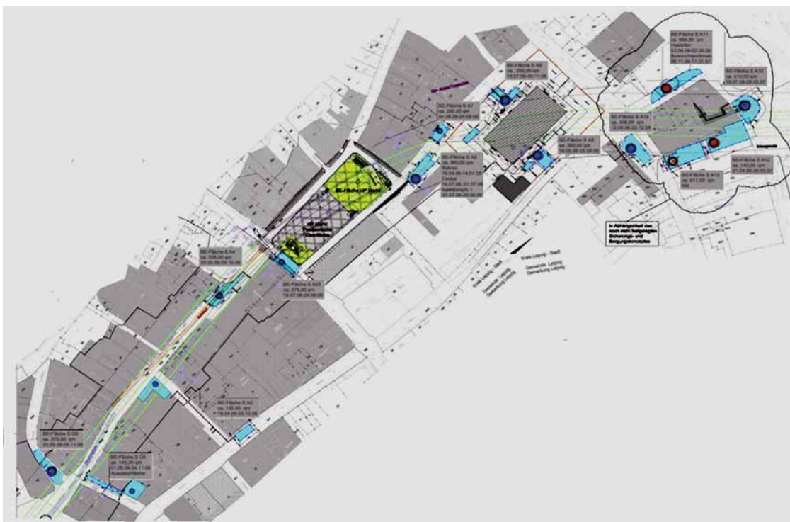
Bild 4. Anordnung der Bohrschächte im zentralen Bereich der Innenstadt.

Die Maßnahmen dienen somit nicht vordergründig der Sicherheit des Tunnelvortriebs selbst, sondern erhöhen die Sicherheit für die zu